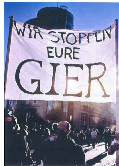
Verteilt sich eben so: die fetten Gewinne als Banker-Anreiz da sorgen für den Frust dort. Ein Interessenkonflikt, der gerade im Occupy-Protest gegen die Banker ausgetragen wird.

Herr Nolte, wir kriegen immer häufiger den Rat, uns einen Kartoffelacker zuzulegen, um nach dem Crash noch etwas zu beißen zu haben. Raten Sie auch dazu?